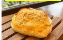
「キタノカボチ(明太)」 270円(税込み)