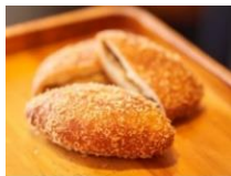
「カリカリミンチカレー」 303円(税込み)