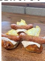
※価格はすべて税込み (写真左) 「Assheドック」 380円(税込み) (写真右) 「チョコジャンキー」 380円(税込み)