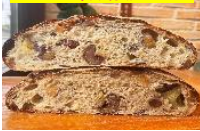
「さつまいもと栗のカンパニユ」 ハーフサイズ/540円(税込み)