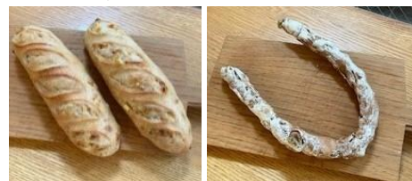
「オレンジ」260円(税込み)