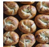
「ビーナツバター塩ホワイトチョコベール」 388円(税込み)

bread, sweets, natural yeast and organic ingredients, etc.