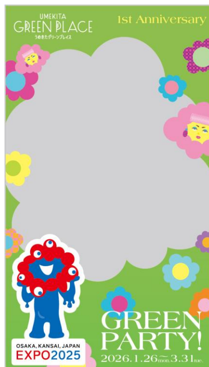
WEB AR フィルター