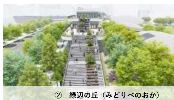
② 緑辺の丘（みどりべのおか）

緑のそばで一息つける場所。1～3階の大階段全体を丘と捉え、自然と一体となった空間。