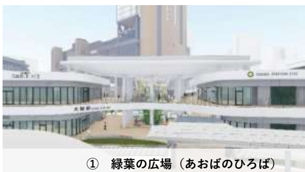
① 緑葉の広場（あおばのひろば）