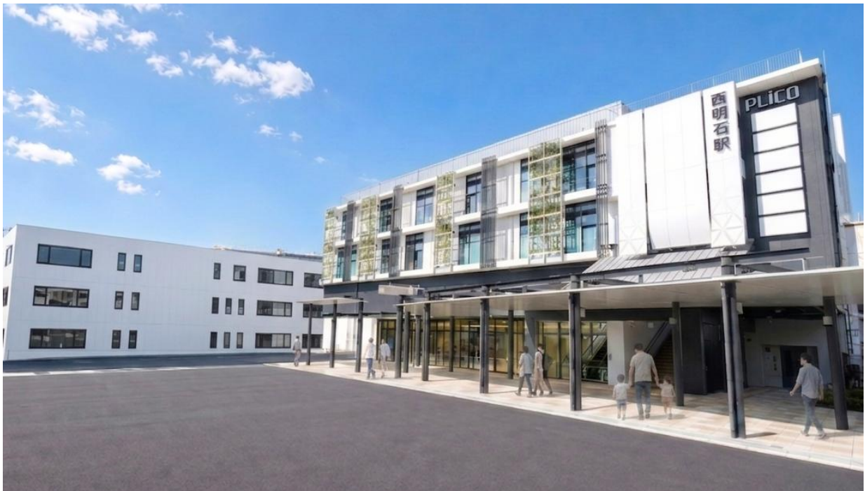
※画像は建設工事中の現地写真を元に生成AIを用いて加工した完成イメージであり、実際の整備とは異なります

このたび、JR西日本が整備する新改札口に加え、JR西日本及びJR西日本不動産開発株式会社が整備する新駅ビル「プリコ西明石 南館」（運営会社：JR西日本アーバン開発株式会社）、ならびに明石市が整備する駐輪場及び駅前広場を、2026年6月26日（金）に開業・供用開始いたします。これに伴い、西明石駅南口のまちびらきを行うことが決まりましたのでお知らせいたします。今後も引き続き、明石市とJR西日本グループで連携し、「JR西明石駅及び駅周辺の安全性と利便性の向上」や「地域交流拠点の充実」に向けて、順次整備を進めてまいります。