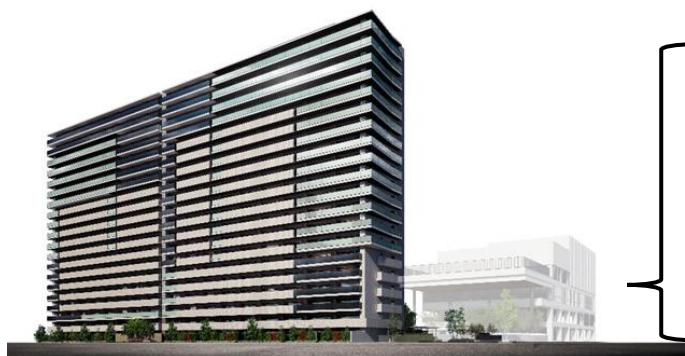
新築分譲マンションのイメージ

西明石地域交流センターicotto（いこっと）については、2027年夏頃の開館を目指して建設工事を進めています。隣接地で新築分譲マンションの建設工事も進んでおり、西明石地域交流センターと同時期の2027年夏頃の完成を目指しています。