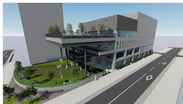
icotto（いこっと）のイメージ