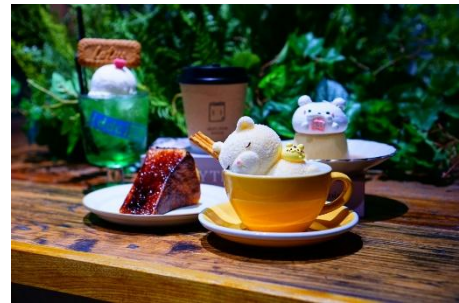
<daily dose coffee>