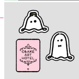
OBAKE ART HOTEL オリジナルステッカー