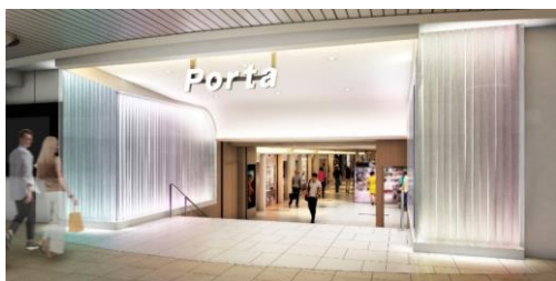
南エリア エントランスイメージ