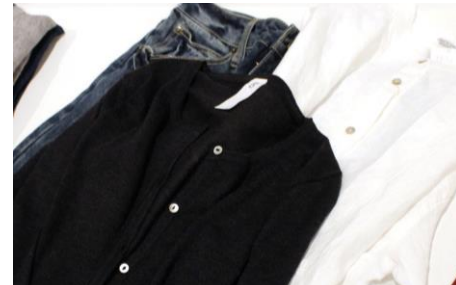
【ムモクテキ グッズアンドウェアーズ】

ポルトガルの自然な環境と、皮膚科医との共同開発によって生まれたオーガニック『固形石鹸』専門ブランド！