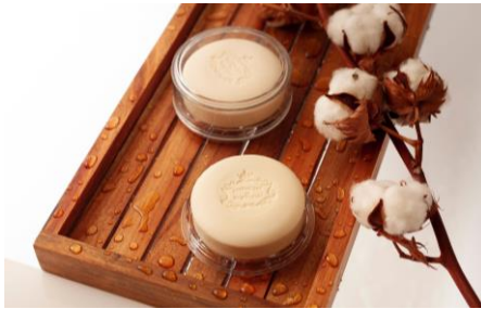
【エッセンシラス デポルトガル】

ファッションに情熱的な人のそれぞれのシーンに寄り添う、モード・ヴィンテージを軸としたオリジナルブランドが関西初出店！