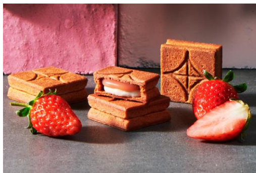
バターサンド<あまおう苺> 5個入 1,296円（税込）

今回は、季節商品「あまおう苺」がオススメ！あまおう苺ジャムを練り込んだバタークリームと、あまおう苺の濃縮果汁を使用したバターキャラメル。口に入れる直前に漂うあまおう苺のふわとした香り、甘みと酸味が調和したバターとキャラメルの風味が楽しめる華やかなバターサンドです♪