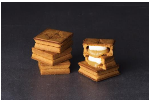
バターサンド 5個入 1,107円（税込）