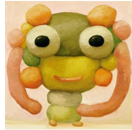
AKIKO(キャンバスに油彩、55x55cm、2022年価格：418,000円(税込み))

【日時】2023年3月3日(金)～12日(日) / 【場所】ルクア イーレ4F イベントスペース「sPACE」