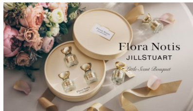
「フローラノーティス ジルスチュアート」 厳選された植物オイルやエキスなど天然香料を 配合したボディケアやヘアケア製品などを取り扱う ライフスタイルブランド！