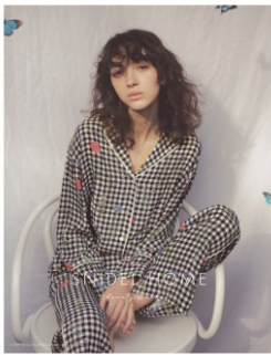
「スナイデルホーム」 全てのアイテムに美容成分が施された ルームウェアブランド！

JR西日本SC開発株式会社(大阪市北区梅田)が運営するファッションビル“LUCUA osaka”は、この春、LUCUAとLUCUA 1100に合計18店舗の新しいショップがオープンいたします。美容成分を含んだルームウェアの「スナイデルホーム」や人気アパレルブランドのメンズショップ「メゾンスペシャル メンズ」といったファッション店舗が10店舗オープンするほか、ジル・スチュアートのライフスタイルブランド「フローラノーティス ジルスチュアート」、韓国コスメのセレクトショップの「コスメリメイク」といったコスメ店舗もオープンし、「りんごとバター。苺のワルツ」という人気2ブランドのコラボスイーツ店舗も関西初出店。アウトドアゾーンでは「アップランド」、「コーズィーテラス」といった2店舗がオープンさらにパワーアップ。またアニメ・マンガ・アートといった日本のカルチャーを発信する「ベースヤード トーキョー」が西日本初出店するなど、ファッションからカルチャーまで、これまで梅田周辺にはなかった注目のショップが続々オープンいたします。