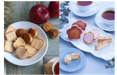
「りんごとバター。苺のワルツ」 青森県産りんご「ふじ」と国産バターを使った生菓 子が楽しめる「りんごとバター。」と、あまおう苺を 使用したスイーツが楽しめる「苺のワルツ」の コラボ直営店舗！