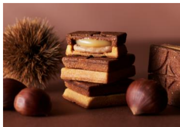
〔バターサンド〈栗〉 5個入〕 税込1,296円

※ 写真等はイメージです。メニュー名称等は変更になる場合がございます。また、都合により、取り扱い商品や価格が変更になることがあります。