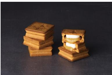
〔バターサンド 5個入〕 税込1,026円