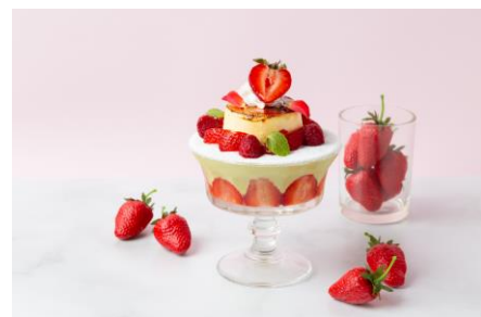
「パフェ&ジェラート ラルゴ」オリジナルパフェを作ろう！