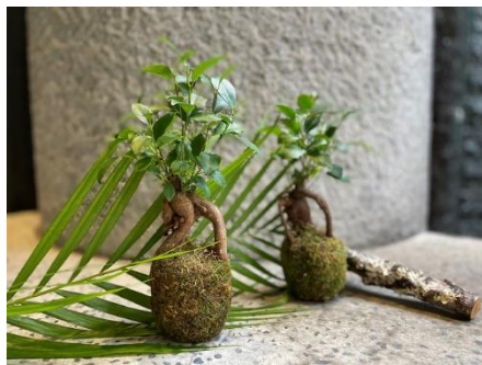
「ロビネペタル」ガジュマルの苔玉づくりワークショップ

「ニーマルイチャボ」…自分だけのカラフルなフレグランスジェルをつくろう！ 「スタイルテーブル」…楽しく作れる！お菓子の袋で作るエシカルポーチ 「コノカ」…きらめくフラワーハーバリウム作り！／世界に1つドライフラワーボトル作り！ 「ナチュラルキッチン アンド」…夏休みの工作やインテリアにおすすめ！オリジナル時計作り 「タリーズコーヒー」…世界にひとつだけのタンブラーを作ろう 「きものやまと」…きものやゆかたのはぎれを使って、季節のカレンダーやうちわを作ろう！