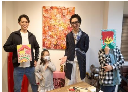
「ザニーエクスポ」自由に、楽しく！いろいろな画材で絵を描こう！

「デイリリー」…台湾の伝統に触れる！虎頭包（とらあたまづつみ）でおやつを包もう！ 「注染手ぬぐい にじゆら」…大阪の伝統技法・注染でハンカチを染めよう！ 「マールマール」…LUCUA de 知育ワークショップ 「きものやまと」…やまとクロゼット（やまとのゆかたレンタル） 「スタジオカフェ ズーアドベンチャー」…アフリカへのアクションに繋がるギフトカード作り／子供の絵がiPhoneケースのデザインに！