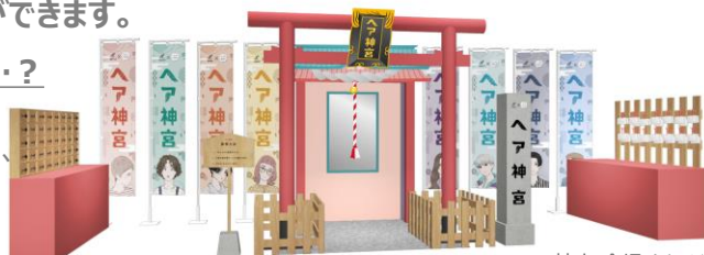
※ヘア神宮 会場イメージ

(ヘアスタイル監修美容室： Authen・FURUSHO・femme/AMIES・L-MARK・LUAU Ao)