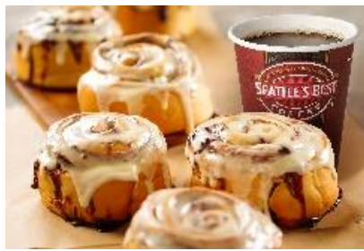
シアトル生まれのシナモンロールを展開する「シナボン」と「シアトルズベストコーヒー」がコラボした「シナボン・シアトルズベストコーヒー」