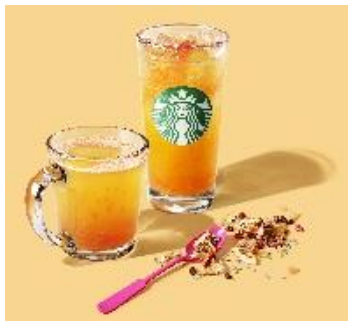
“ティー”を楽しむ、新しいスターバックス！ 「スターバックス コーヒー」

“ティー”に特化した新しいスターバックスの体験が楽しめる「スターバックス コーヒー」が西日本初出店のほか、シアトル生まれのシナモンロールを展開する「シナボン」と「シアトルズベストコーヒー」がコラボした「シナボン・シアトルズベストコーヒー」がカフェ店舗として関西初出店、また、アパレルからフレグランスまで幅広いアイテムを展開し、多くの層から支持され続けるブランド「カルバン・クライン」など、注目のNewショップが続々オープンいたします。