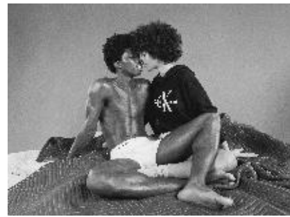
アパレルからフレグランスまで幅広いアイテムを展開し、多くの層から支持され続けるブランド「カルバン・クライン」