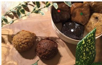
一杯のお味噌汁が味わえるお店 85(ハチゴウ)