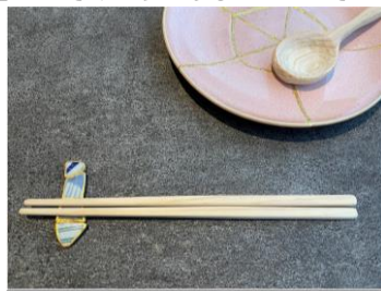
「間伐材を活用したオリジナルお箸作り」

[ワークショップ予約サイト] https://lucuaosaka.official.ec/