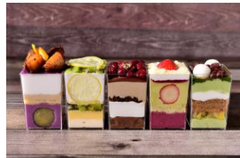
「LARGO」5種セットギフトパフェ 4,000円(送料込み・税込み)

[PACE ONLINE SHOP] https://lucuaosaka.official.ec/