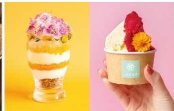
限定のジェラートが楽しめる PARFAIT&GELATO LARGO