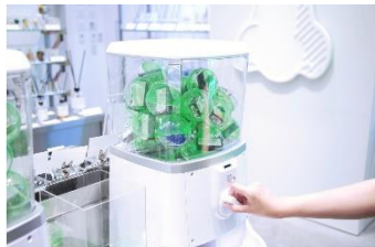
香水ガチャを展開する NOSE SHOP

その日のあなたのペースに寄り添えるような9つのお店を取り揃えました。ニッチな香りが入っている「香水ガチャ」でその日の運命に任せた香水を選んでみたり、バリスタスクールに通ってみたり、地球にも自分にも優しいモノを知ってみたり、お買い物に疲れたら、一杯のお味噌汁を飲んでみたり、アートを眺めてみたり、ここでしか食べられない特別なスイーツに癒されてみたり。思い思いのペースで楽しめるコンテンツをご用意しています。