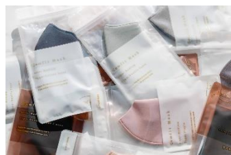
「We'll」Cool Comfit Mask 990円(税込み)