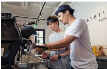
バリスタスクールも開講する PATHFINDER XNOBU