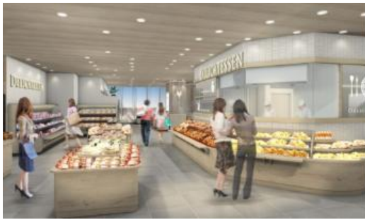
(1階「ユアーズ」店舗イメージ)

ーマに品揃えし、さらに上質な食材をご提供いたします。日常的に岡山駅をご利用されるお客様の台所として 365 日いつも新鮮で、ときめきと出会いがある、ライブ感あふれる上質なスーパーを目指します。