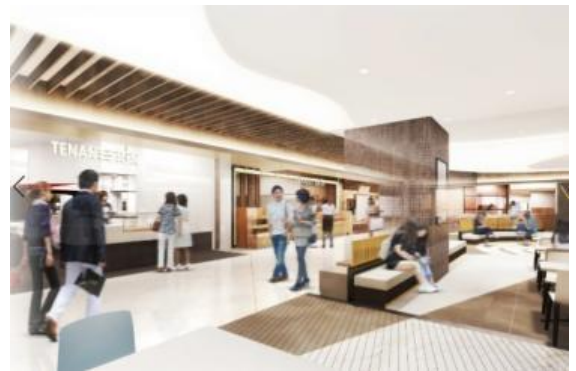
(2階飲食ゾーンイメージ)

観光やビジネスで岡山駅をご利用されるお客様をメインターゲットに、お弁当・惣菜などの食料品をはじめバラエティ豊かな飲食店が並び、「食」のゾーンを展開いたします。駅でお食事をされる方がご利用しやすいよう、飲食店舗数は5店舗⇒13店舗へ大幅に拡大するとともに、弁当などのテイクアウトへの対応も強化いたします。車内でのお食事をお求めの方やお急ぎの方にクイックに対応した店舗や、おひとりからグループまで様々な人数に対応できる店舗を配置し、お客様の様々なニーズに対応いたします。