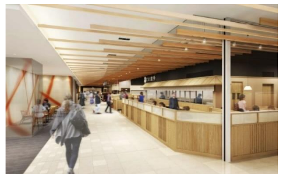
(1階飲食ゾーンイメージ)

スーパーマーケットは、さんすて岡山開業当時から十数年、皆様にご愛顧頂いてきた「ユアーズ」がパワーアップして出店いたします。「健康」「即食・簡便」「地元」「こだわりの逸品」をテ