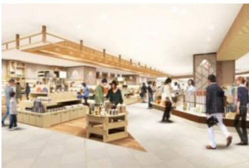
(2階「おみやげ街道」店舗イメージ)

新幹線改札前という立地を活かし、駅ナカでお土産・お弁当を展開する株式会社ジェイアールサービスネット岡山が、「おみやげ街道」を展開いたします。リニューアル前と比較し、約4倍の売場面積にパワーアップした県下最大級のお土産売場では、岡山、瀬戸内エリアのお土産をラインアップするとともに、地域の素材を活かした「駅ナカ限定商品」を販売するコーナーを新たに設け、これまで以上に県外からのお客様に岡山、瀬戸内エリアの魅力を感じて頂けることを目指します。