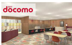
ドコモショップ 【本館8F】