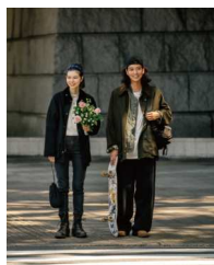
フリークス ストア 【プラザ館2F】