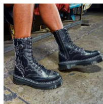
ドクター・マーチン 【本館2F】