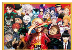
JUMP SHOP