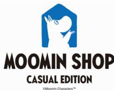
ムーミンショップ カジュアルエディション