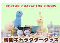
K'FESTA 韓国キャラクター STORE